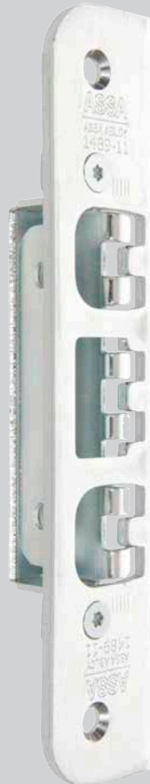
Säkerhetslutbleck Connect 1489-11/1489-12